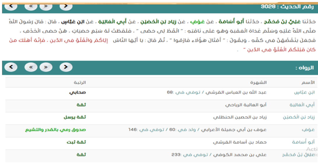
Gambar 2.3 Teks Hadis beserta Sanad dan Perawi

Setelah hadis yang dicari ditemukan, pengguna dapat membaca teks hadis secara lengkap. Platform ini umumnya menyajikan informasi terkait sanad (rangkaian perawi), matan (teks hadis), serta keterangan mengenai derajat hadis. Informasi ini sangat membantu dalam proses analisis kualitas dan keabsahan hadis.